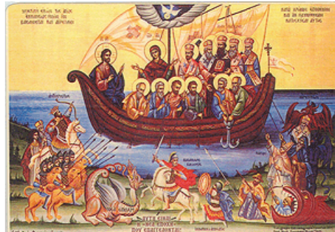
სახე წმიდა ეკლესიისა, რომელსაც თავს ესხმიან ერეტიკოსები: რომის პაპი, პროტესტანტები, არიოზი და სხვები

რომლებიც, ფაქტობრივად, მთელ ეკლესიას მოიცავდა. ამგვარი კრებები, რომლებსაც ჰქონდად ნამდვილად მსოფლიო ხასიათი, შესაძლებელი იყო მხოლოდ იმპერატორ კონსტანტინეს პერიოდში და მის შემდეგ. საერო ხელისუფლება იმპერატორის სახით ხელს უწყობდა ამგვარი კრებების მოწვევას. და თავად მათი ისტორია გვეუბნება იმის შესახებ, რომ იმპერატორები, წმ. იმპერატორ კონსტანტინესაგან დაწყებული, მსოფლიო კრებებს უყურებდნენ როგორც ეკლესიაში და იმპერიაში მშვიდობის განმტკიცების საშუალებას, რადგან საეკლესიო დაჯგუფებებს შორის დოგმატურ საკითხებთან დაკავშირებული დაპირისპირებები ხშირად გადადიოდა მოქალაქეებს შორის სერიოზულ დაპირისპირებაში. კრებების შედგენის სირთულედან გამომდინარე, მათი მოწვევა ხდებოდა მხოლოდ უმნიშვნელოვანეს, სახელდობრ, დოგმატურ საკითხებთან დაკავშირებით. ეპისკოპოს ნიკოიმოსის (მილაში) თქმით, მსოფლიო კრებები „არ წარმოადგენდნენ მუდმივ საეკლესიო დაწესებულებას, როგორც, მაგალითად, სამიტროპოლიტო კრებები, არამედ ისტორიულად წარმოადგენდნენ განსაკუთრებულ დაწესებულებებს, რომელთა მნიშვნელობა წვდებოდა არა მხოლოდ მთელ ეკლესიას, არამედ მთელ სახელმწიფოსაც“ (3) .